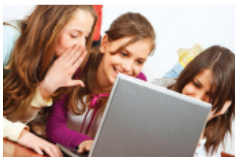
Les réseaux sociaux et messageries sont particulièrement chronophages chez les adolescentes.

Est-ce encore la société de consommation qui se cache derrière cette supposée convivialité ? Quel est ce bain d'apparente gratuité dans lequel macèrent nos jeunes avec délectation ? Ces questions qui me taraudaient depuis un moment ont été mises en lumière par un événement choc qui pourtant semble être passé pratiquement inaperçu en Europe. Le réseau social Facebook rachète l'application de messagerie instantanée WhatsApp pour la somme pharaonique de 19 milliards de dollars... Qu'est-ce que cela signifie pour les non-initiés ? Que recèle donc la partie immergée de l'iceberg des réseaux sociaux et de la messagerie mobile qui ne cessent de courtiser la jeunesse.