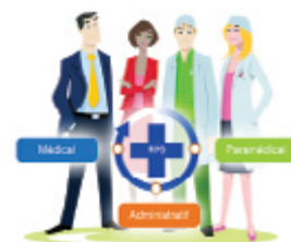
Les réseaux sociaux de santé, un moyen qui a simplifié les relations patients-médecins assureurs et administratif.

Les messageries instantanées permettent d'échanger des messages sans avoir à payer les SMS. L'utilisateur reste en contact avec tous ses amis sans devoir passer par le net, c'est un marqueur de l'application qui envoie un signal